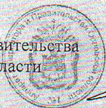
В. В. Потомский

Председатель Правительства Орловской области